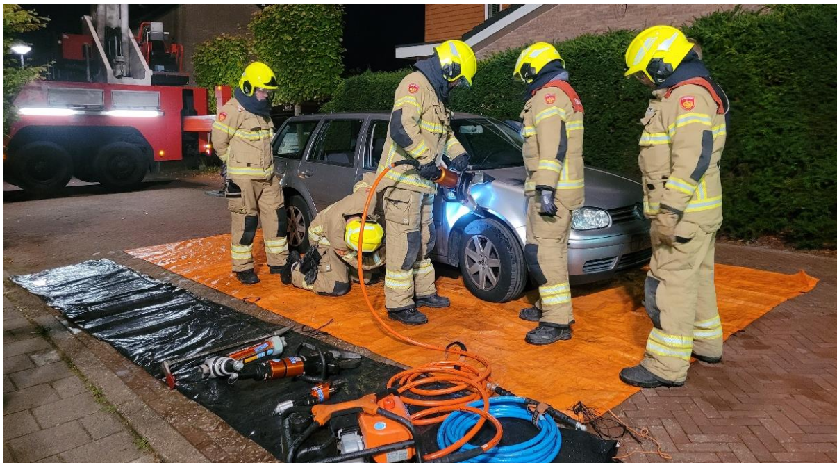
De zes deelnemende posten hebben hun open oefenavond creatief ingericht om de verschillende aspecten van het brandweervak aan de kandidaten te laten zien én ervaren.

Na deze succesvolle werving gaan wij in maart door met de volgende gezamenlijke wervingscampagne. Deze keer doen er zelfs 12 posten mee, verspreid over de hele regio Noord-Holland Noord, die op dit moment het hardst nieuwe leden nodig hebben.