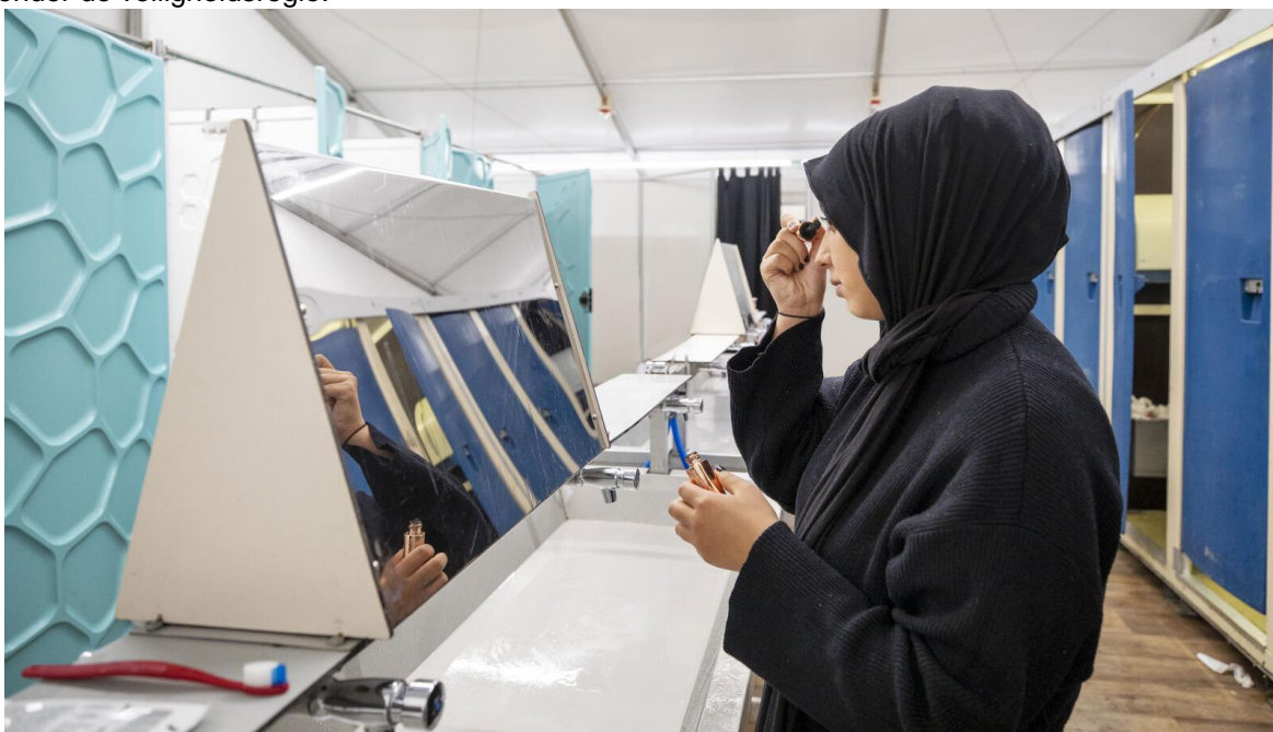
Afgelopen jaar boden wij vier crisisnoodopvanglocaties voor de opvang van 450 asielzoekers.

De vluchtelingen uit Oekraïne worden ook nog gehuisvest in de gemeenten in Noord-Holland Noord. We voldoen nog steeds aan de taakstelling in het land. De coördinatie van deze opvang viel ook in 2023 onder de veiligheidsregio.