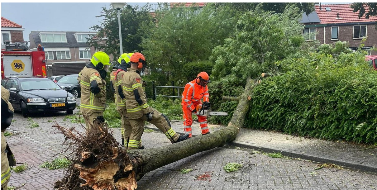
Onze brandweervrijwilligers hielpen in de hele regio om de bomen van huizen en wegen te halen.

Om overbelasting van onze meldkamer te voorkomen vroegen we mensen om alleen 112 te bellen bij levensbedreigende situaties. Maar omdat het 112-netwerk toch overbelast dreigde te raken, startte de brandweer op ons hoofdkantoor in Alkmaar de 'decentrale uitgifte' op, in samenwerking met Bevolkingszorg. De niet-levensbedreigende meldingen, zoals een omgewaaide boom op een doorgaande weg, zijn via deze decentrale uitgifte aan de brandweereenheden en de gemeentelijke buitendiensten doorgegeven. Rond 15:00 uur waren er zo'n 400 meldingen afgehandeld. Brandweerploegen boden ter plaatse ook meteen (andere) hulp aan die op dat moment nodig was. Rond 12:30 uur werd het weeralarm ingetrokken. Wel waarschuwden we mensen om nog voorzichtig te zijn. Over de wegen lagen nog bomen en takken die nog niet opgeruimd waren. Ook in de bossen en parken konden bomen of takken toch nog vallen.